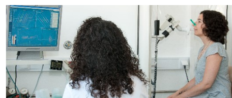
AVALIAÇÃO FUNCIONAL INTEGRADA