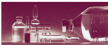
DOSEAMENTO DE FÁRMACOS