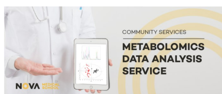
SERVIÇOS DE ANÁLISE DE DADOS METABOLÓMICA