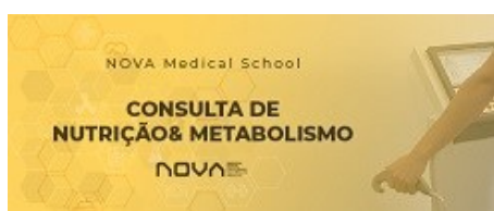
CONSULTA DE NUTRIÇÃO & METABOLISMO