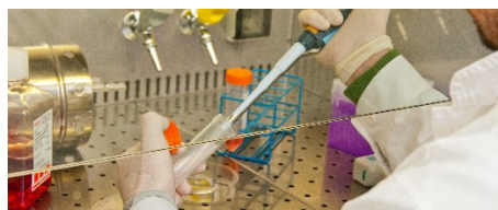
SERVIÇO DE BIOLOGIA CELULAR