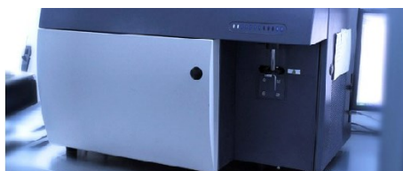
CITOMETRIA DE FLUXO