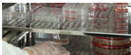
PESQUISA DE HELICOBACTER PYLORI