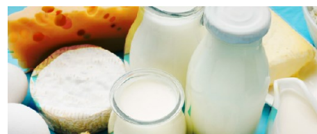
TESTE DE INTOLERÂNCIA À LACTOSE